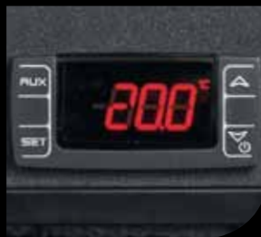
Termostato / Thermostat