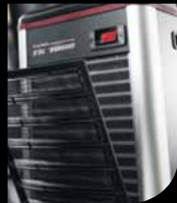
Filtro / Filter