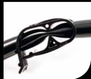
Pinza schiaccia tubo "Squeeze tube clamp"